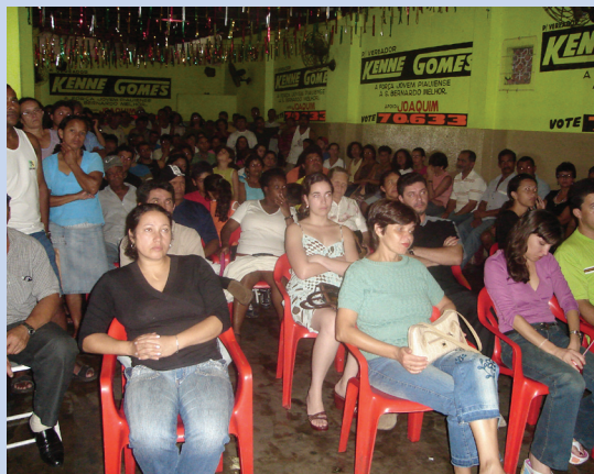
Assembléia no Jd. Falcão